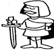
SEÑOR EXPLOTA AL