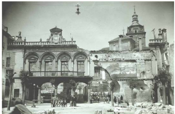
Lámina 4. El balcón de los Corregidores destruido a comienzos de la Guerra Civil.

En esta foto se puede comprobar que esa fachada fue destruida durante la revolución social y posteriormente reconstruida por el régimen fascista. Hoy en día estos mismos son los que la mantienen en pie y protegida para seguir haciendo proselitismo de sus ideas y recordando a nuestro abuelos fusilados en las tapias del cementerio por conseguir un mundo libre e igualitario.