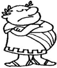
AMO EXPLOTA AL