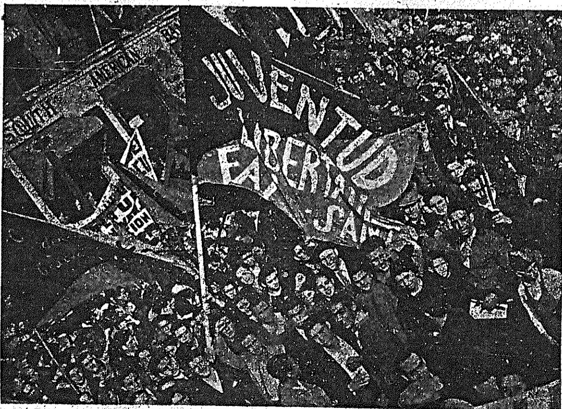
¡Movilización del proletariado mundial en defensa de nuestra Causa!

La guerra necesitamos ganarla: Unión y lealtad, camaradas... ¡Eso es suficiente!