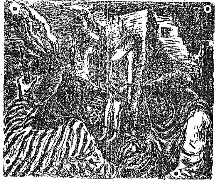
Vengaremos tanta barbarie y sobre las ruinas de las ciudades arrasadas por la Bestia fascista echaremos los cimientos firmes de una Sociedad nueva, libre y humana.

El lamentable pleito existente en la sindical hermana ha entrado ya en su fase decisiva. Se ha creado ahora una situación tan sumamente difícil y delicada que nos obliga a excedernos en prudencia y