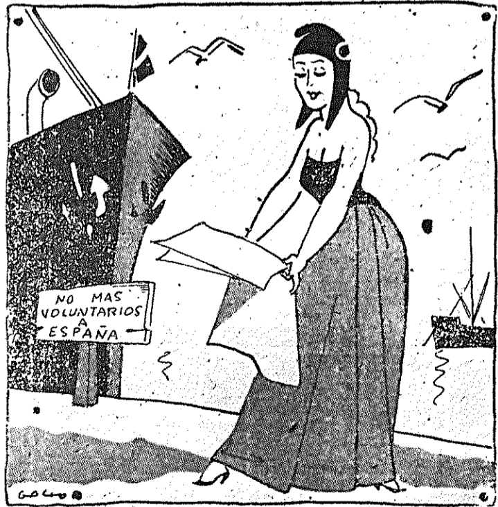
Acabó de renunciar el Subcomité de No Intervención y ha estudiado la posibilidad de la retirada «simbólica» de los «voluntarios» que luchan en España. ¿Quedará todo en un «símbolo»?

Se ha hablado constantemente y se sigue hablando por altos límites si por las palabras hubiera de calibrarse su cumplimiento, pero lo cierto es que la preside todos nuestros actos. Cada cual pretende dominar posiciones al adversario político. Todos y cada uno pensamos en captar al pueblo hacia nuestras organizaciones y partidos. No se realizan actos que no tengan un fondo de proselitismo, bandería y absorción. No podemos seguir por este camino. Es hora ya que nos lancemos decididamente a estrechar los lazos de la unidad, no con palabras, sino con hechos, prácticamente realizados y noblemente cumplidos. Eso es lo que pide la C. N. T., en estas horas graves y difíciles para el pueblo antifascista y libre de España.