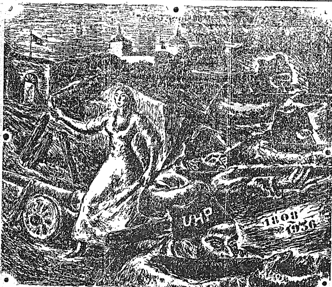
La historia se repite. Unidos conquistaremos ahora también en la independencia y la libertad de España. En nuevo y glorioso aniversario de la Revolución de Asturias un firme propósito ¡vencer!

Realización de un programa de intensa propaganda, tendente, no sólo a demostrar a las democracias la barbarie del fascismo internacional y su intervención en España, sino también a despertar de su letargo al proletariado internacional, sumándolo a nuestra causa.