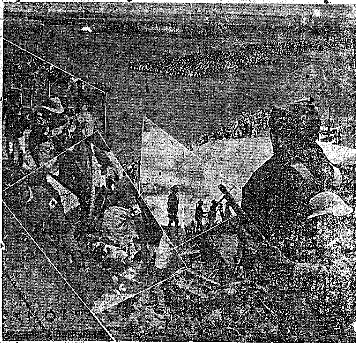
La Alianza Juvenil Antifascista, reconociendo la transformación político-social y económica operada en nuestro país, después del 19 de Julio del año pasado, se compromete a consolidar e impulsar las conquistas revolucionarias. Asimismo, las organizaciones juveniles trabajarán constantemente por la alianza de las organizaciones sindicales C. N. T.—U. G. T., para ganar la guerra y desarrollar la revolución. Del mismo modo verán con simpatía la unidad de las fuerzas sindicales políticas afines; para el mismo fin. Las Juventudes integrantes de la Alianza se pronuncian en el sentido de que todas las organizaciones políticas y sociales de nuestro pueblo, encuadradas en el marco antifascista, estén representadas en la dirección del mismo en relación a sus fuerzas e influencia, previa la elaboración de un programa común para facilitar nuestro triunfo sobre el fascismo y afianzar la marcha de la revolución. (Primera base de la Alianza Juvenil Antifascista)

La juventud que derrama su sangre en los frentes por la Revolución, y con ella toda la nueva generación española, considera necesario, para llevar victoriosamente la lucha contra el fascismo invasor, la existencia, en la retaguardia, de un sólido orden revolucionario.